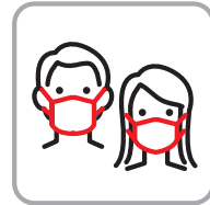
マスク着用チェック